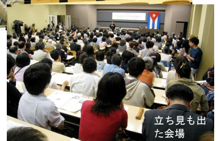
立ち見も出た会場