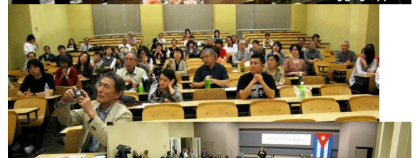
↑会場に入りきれなかつた人のために急遽、第2会場を設定。講演をTVモニターで中継