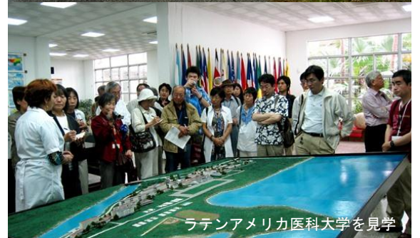
ラテンアメリカ医科大学を見学