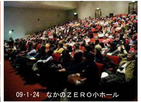
09・1・24 なかのZERO小ホール