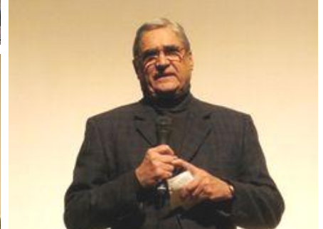
09・1・24 「革命から50年。この間、キューバはアメリカの圧力に屈しませんでした」とホセ・フェルナンデス・デ・コシーオ駐日キューバ大使の挨拶